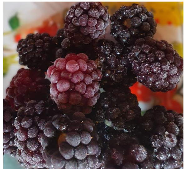
Kuva 2. Peltosirkun tilan pakastettuja karhunvadelmia.

Sirkku Holttinen (Peltosirkun tila) kertoo karhunvadelman tunneliviljelystä ja Juha Sipponen (Rauhalan luomutila) marjasinikuusaman (hunajamarja; haskap) luomuviljelystä. Tule kuuntelemaan viljelijöiden kokemuksia ja maistelemaan marjoja. Klo 14 lähtö päärakennukselta tutustumaan keväällä 2024 perustetulle Lepaan marjasinikuusamaviljelmälle.