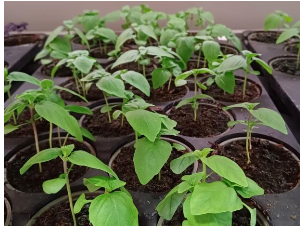
Kuva 1. Thaibasilikan taimia vertikaaliviljelykontissa.

Lepaan viljelykontti on avoinna yleisölle ja esittelijä on paikalla torstaina ja perjantaina klo 15–16. Kontissa kasvaa erilaisia basilikalajikkeita.