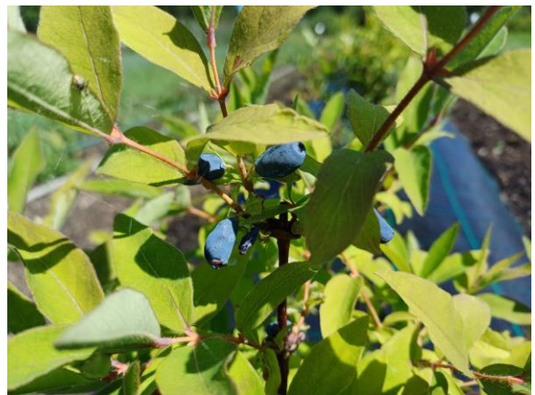
Kuva 3. Marjasinikuusaman marjoja.